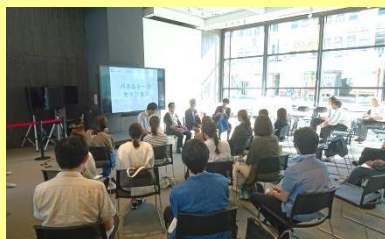
先輩社員のゲストトーク